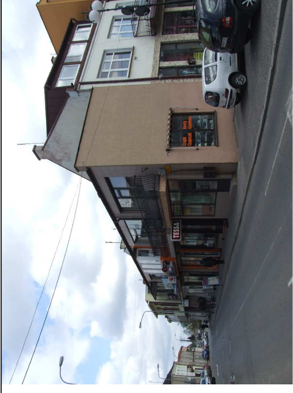
Pawilony handlowe przy ul. Przejazd