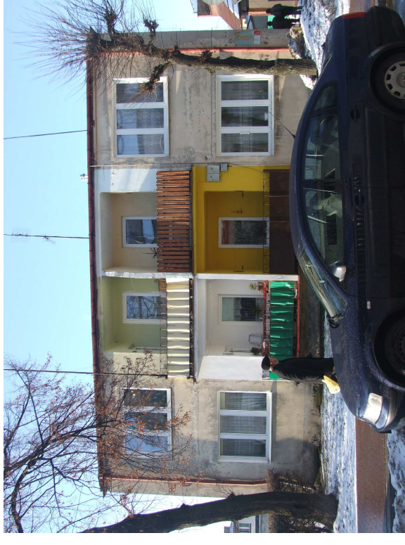
Budynki mieszkalny przy ul. Zdunskiej 8