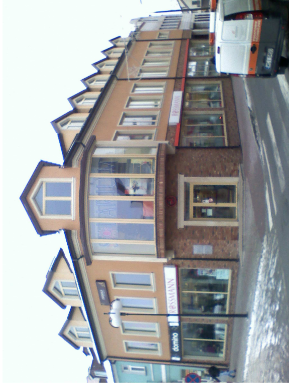
Kamienica na północno-zachodnim narożu Rynku-pl. 15-go Sierpnia 4