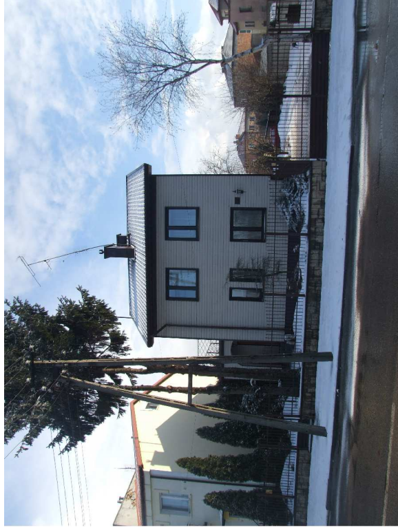
Budynki przy ul. 19-go stycznia 34a -siding PVC naprzeciwko grodziska