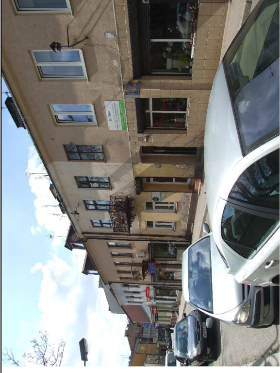
Kamienice do rewitalizacji przy ul. Plockiej (od prawej nr 20)