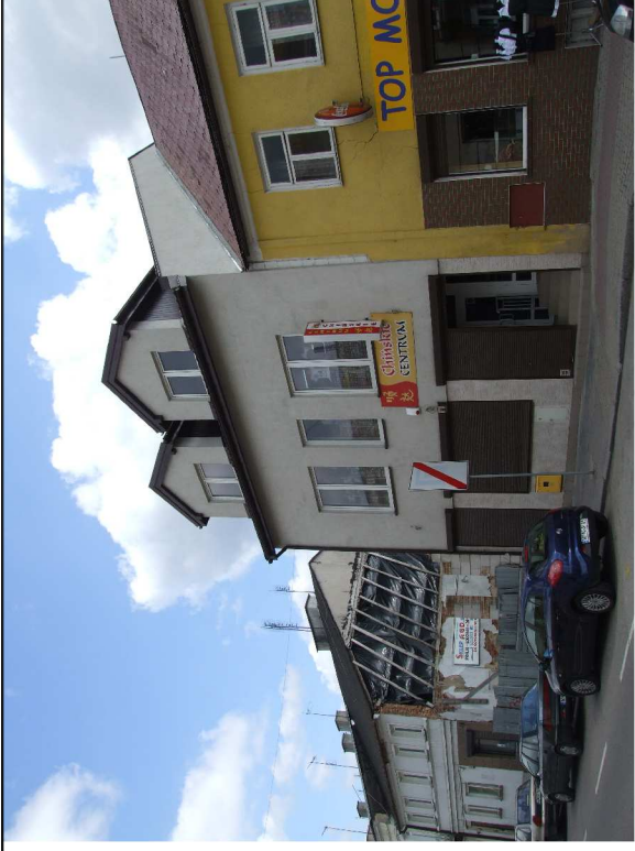
Kamienica przy południowo-wschodnim narożu Rynku -ul. 19-Stycznia 2