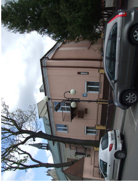
Budynki poklasztorny przy ul. Plockiej 19 do rewitalizacji