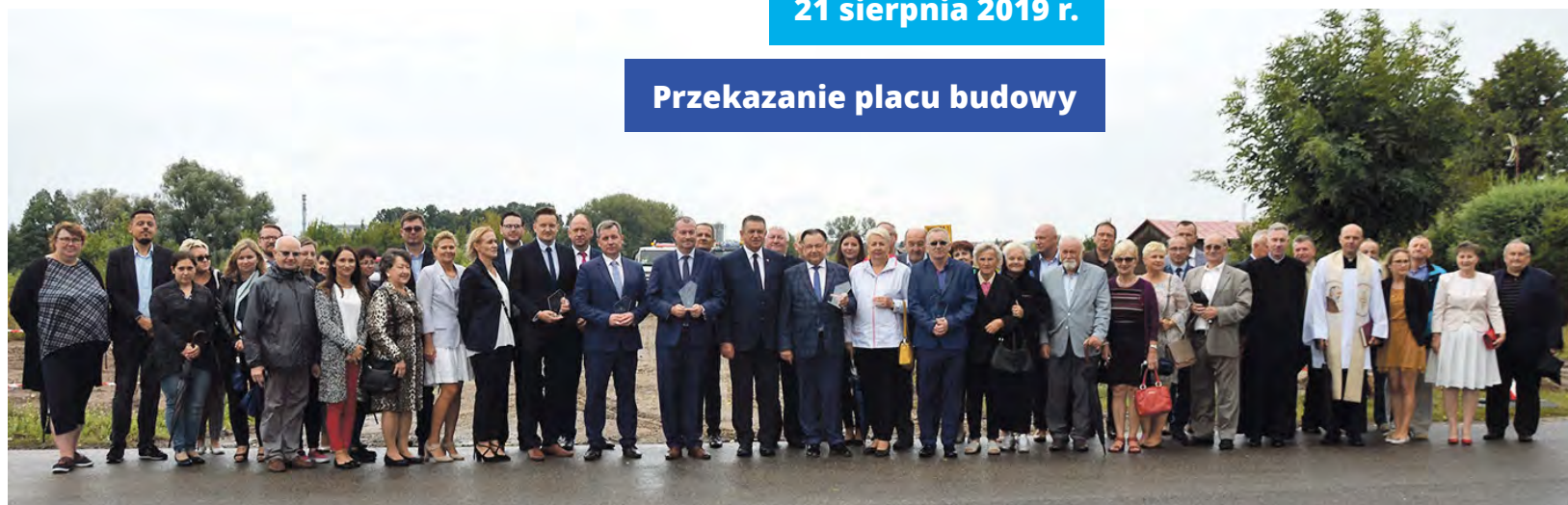
Przekazanie placu budowy