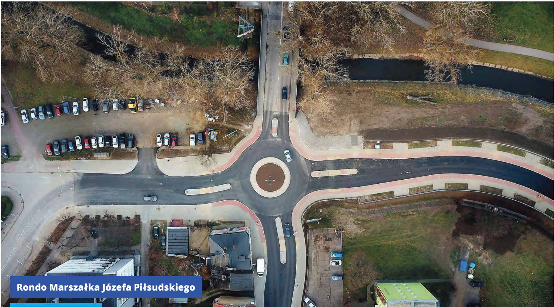
Rondo Marszałka Józefa Piłsudskiego