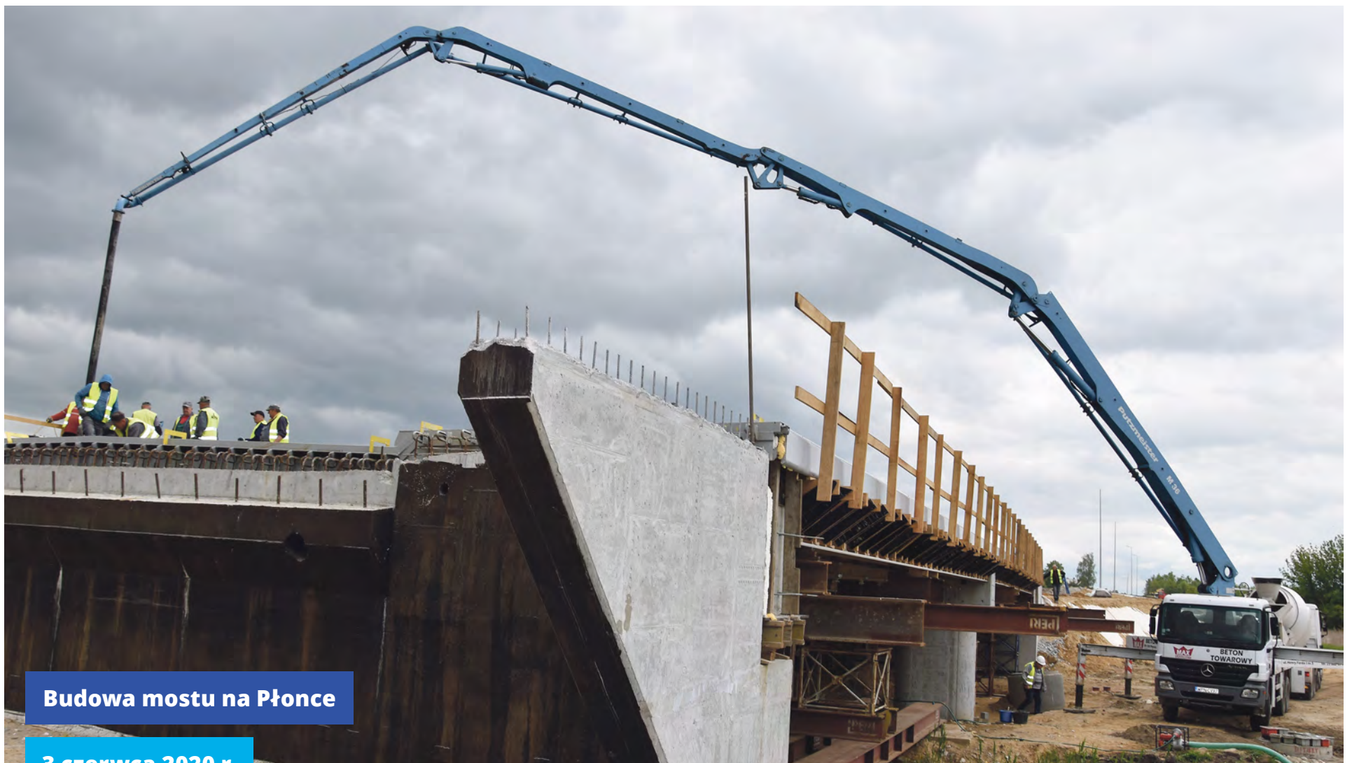
Budowa mostu na Płonce