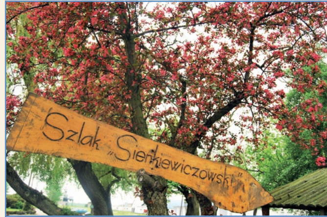
Drogowskaz kierujący do otwartego w listopadzie 2006 roku Szlaku Sienkiewiczowskiego, prowadzącego od ziemiańskiego dworu Weyherów do kolejnych miejsc pamięci, związanych z pobylem Henryka Sienkiewicza w Płońsku.

W 2006 roku, w Płońsku – z inicjatywy Towarzystwa Miłośników Ziemi Płońskiej – otwarty został Turystyczny Szlak Sienkiewiczowski. Wiedzie on przez miejsca związane z pobylem pisarza w Poświętnem bądź go upamiętniające. Na trasie Turystycznego Szlaku Sienkiewiczowskiego znajdują się m.in.: dwór Weyherów w Poświętnem, zwany „Sienkiewiczówka”, Alejka Oleńki i Aleja Lipowa w parku poświęckim, grób rodziny Weyherów na płońskim cmentarzu parafialnym oraz placówki istniejące na terenie miasta, które obrały za patrona Henryka Sienkiewicza: Miejska Biblioteka Publiczna i I Liceum Ogólnokształcące. Na szlaku znajdują się również te spośród płońskich restauracji, których kuchnia oferuje dania noszące nazwy związane z postaciami z powieści sienkiewiczowskich.