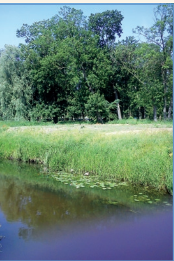
Pozostałości XIX-wiecznego parku podworskiego w Poświętne. Zdjęcie wykonane w 2012 roku.