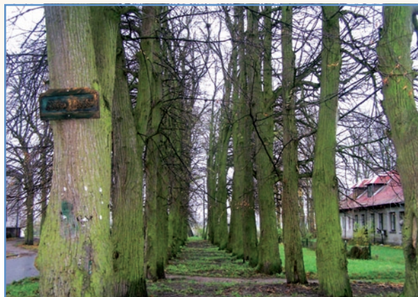
Aleja lipowa na terenie parku podworskiego w Poświętnem na obrzeżach współczesnego Płońska, nazwana od imienia jednej z postaci „Trylogii” Henryka Sienkiewicza, Aleksandry Billewiczówny, „Alejką Oleńki”.

Tuż obok dawnego dworu rodziny Weyherów znajdują się pozostałości parku, który tak zachwyił młodego Sienkiewicza, iż został przez niego opisany w jednym z jego listów. Zachowały się dwie zabytkowe aleje lipowe będące niegdyś częścią parku. Jedną z nich, na pamiątkę pobytu Henryka Sienkiewicza w Poświętnem, nazwano Alejką Oleńki, a tuż obok umieszczony został pamiątkowy głaz z tablicą, na której widnieje napis: „Dokąd zmierzasz, Człowieku... Henrykowi Sienkiewiczowi w 140. rocznicę Jego pobytu w Poświętnem – Płońszczanie”.