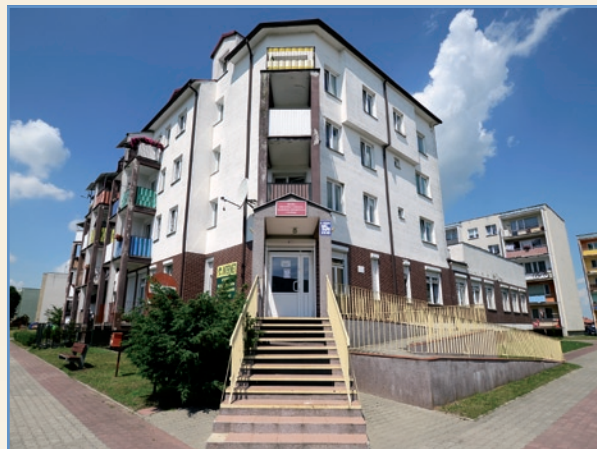
Siedziba Miejskiej Biblioteki Publicznej im. Henryka Sienkiewicza przy ul. Północnej w Płońsku