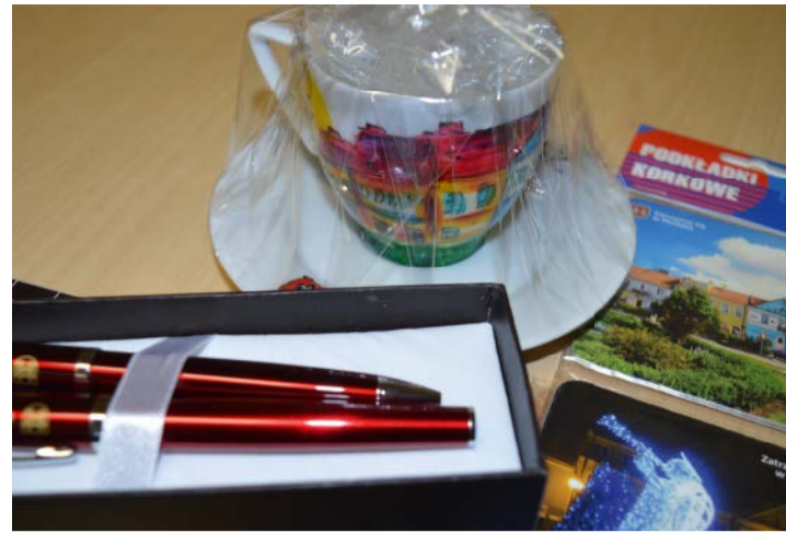
FIRMOWY ZESTAW NAGRÓD

Z liter w zaznaczonych na żółto polach należy przez anagramowanie utworzyć hasło. Osoba, która jako pierwsza 8 lutego 2016 r. w godz. 9:00-9:30 dodzwoni się do Referatu ds. Promocji, Konsultacji i Inicjatyw Społecznych Urzędu Miejskiego i poda rozwiązanie krzyżówki wygra zestaw upominków: komplet długopisów, filiżankę oraz podkładki korkowe. Numer telefonu – 23 663 13 34