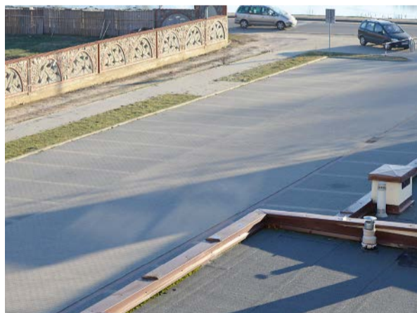
ZAMKNIĘTY PARKING PRZY UL. ZWM

Są pierwsze finansowe konsekwencje decyzji radnych. Powiatowy Inspek-