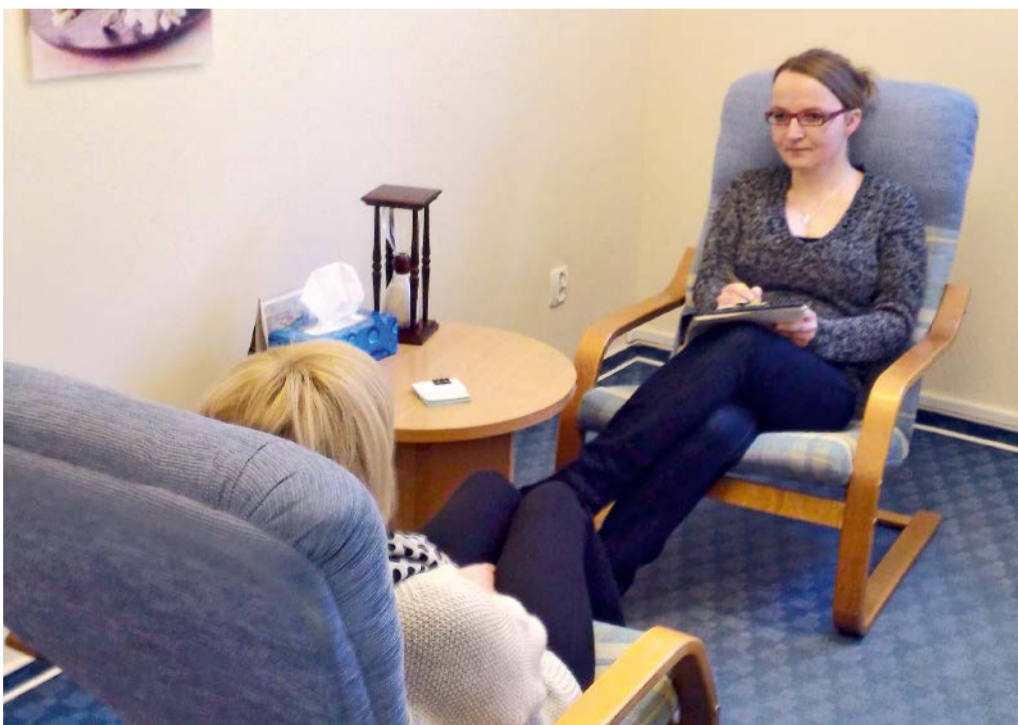
LECZENIE ALKOHOLOWOŚCI WYMAGA POMOCY SPECJALISTÓW

Efektywność leczenia choroby alkoholowej jest wprost proporcjonalna do poziomu zmotywowania i zaangażowania pacjenta, a odwrotnie proporcjonalna do presji i konfrontacji. Oznacza to, że największą rolę w procesie zdrowienia odgrywa zbudowanie indywidualnej, wewnętrznej motywacji do leczenia. Samo leczenie jest procesem długofalowym, wymaga systematycznej współpracy z placówkami lecznictwa odwykowego, czy grupami samopomocowymi Anonimowych Alkoholików i AL.- Anon. ■