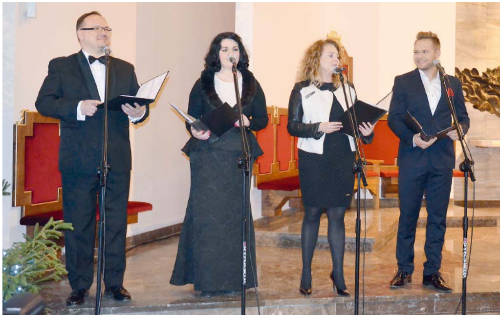
SOLIŚCI FILHARMONII NARODOWEJ W WARSZAWIE