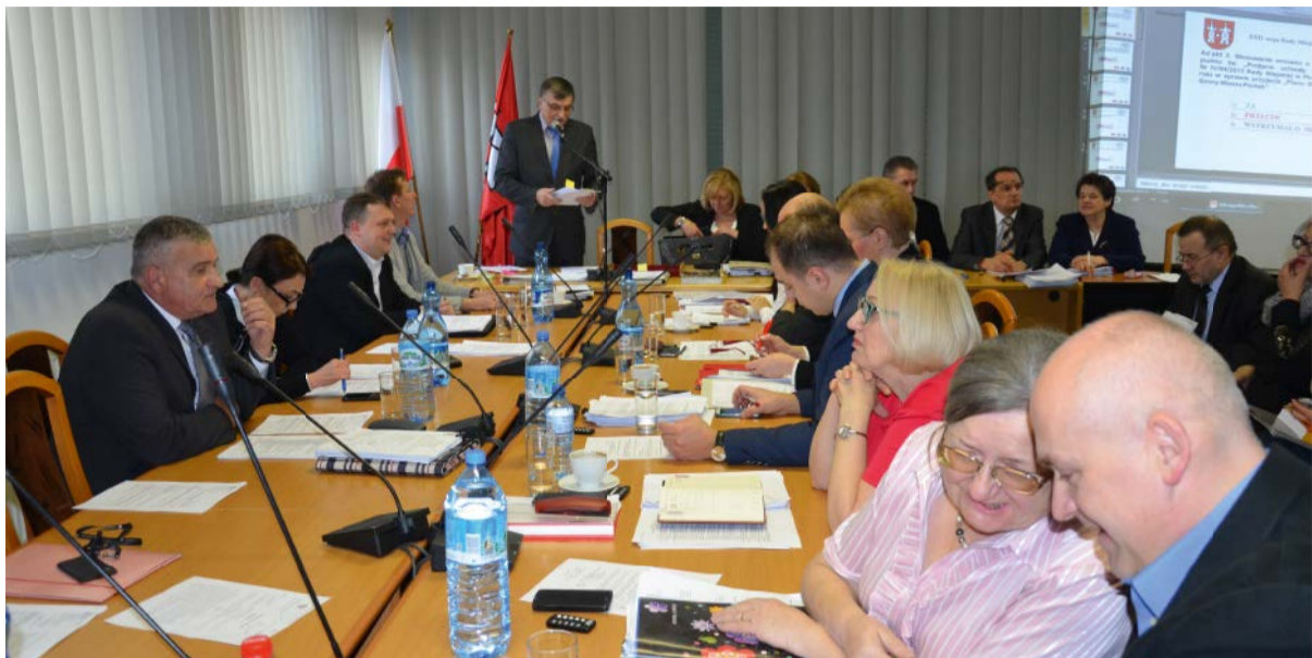
RADNI RADY MIEJSKIEJ PODCZAS XXII SESJI

Piszemy w tym numerze „Gazety Płońskiej” o decyzji Powiatowego Inspektora Nadzoru Budowlanego, który nało-