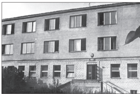
1962 | Budynek internatu