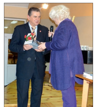
Dni Patrona Szkoły