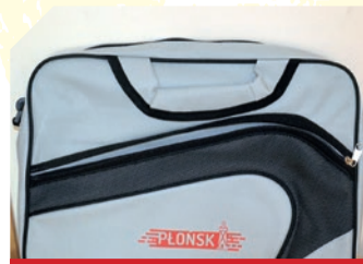
NAGRODA: TORBA NA DOKUMENTY