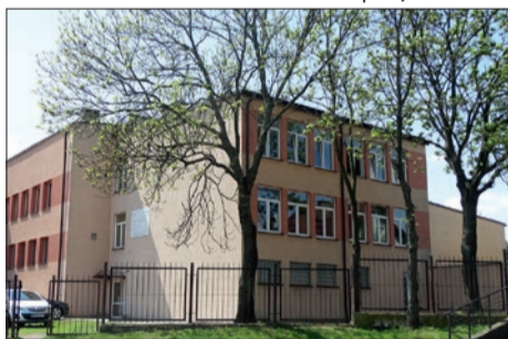
2011-2012 | Rozbudowa szkoły