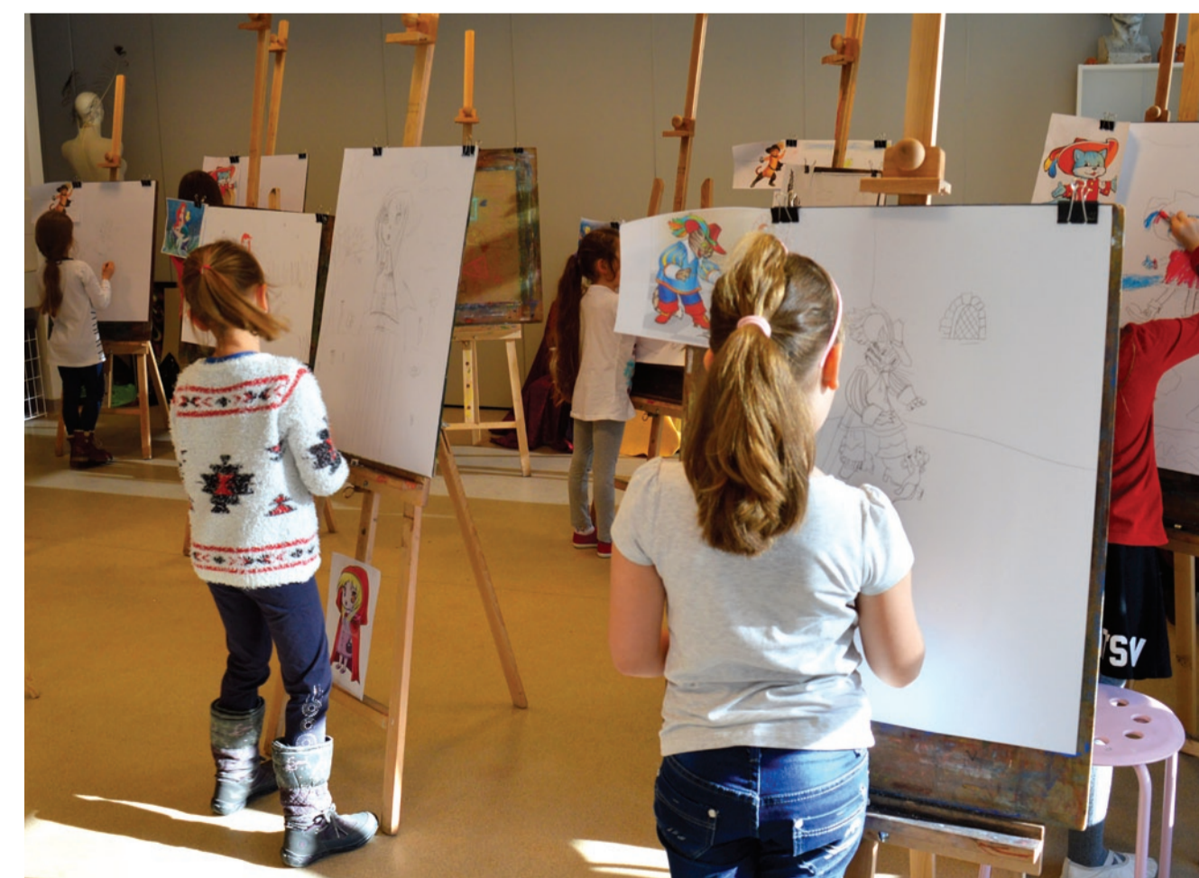
Warsztaty plastyczne w MCK