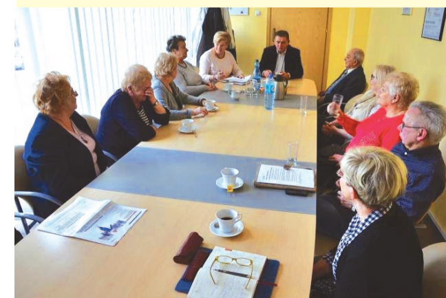
Spotkanie organizacyjne w ratuszu

Kandydatów należy zgłaszać w formie pisemnej, na formularzu zgłoszeniowym będącym załącznikiem do ogłoszenia (www.plonsk.pl, a także Urząd Miejski w Płońsku – pok. 203), w Kancelarii Urzędu lub za pośrednictwem poczty na adres: Urząd Miejski w Płońsku, ul. Płocka 39, 09-100 Płońsk, z dopiskiem „Kandydaci na członków Rady Seniorów Miasta Płońsk”. Wybór członków nastąpi w ciągu 30 dni od daty zakończenia przyjmowania zgłoszeń. Członkowie Rady Seniorów pełnią swoją funkcję społecznie.