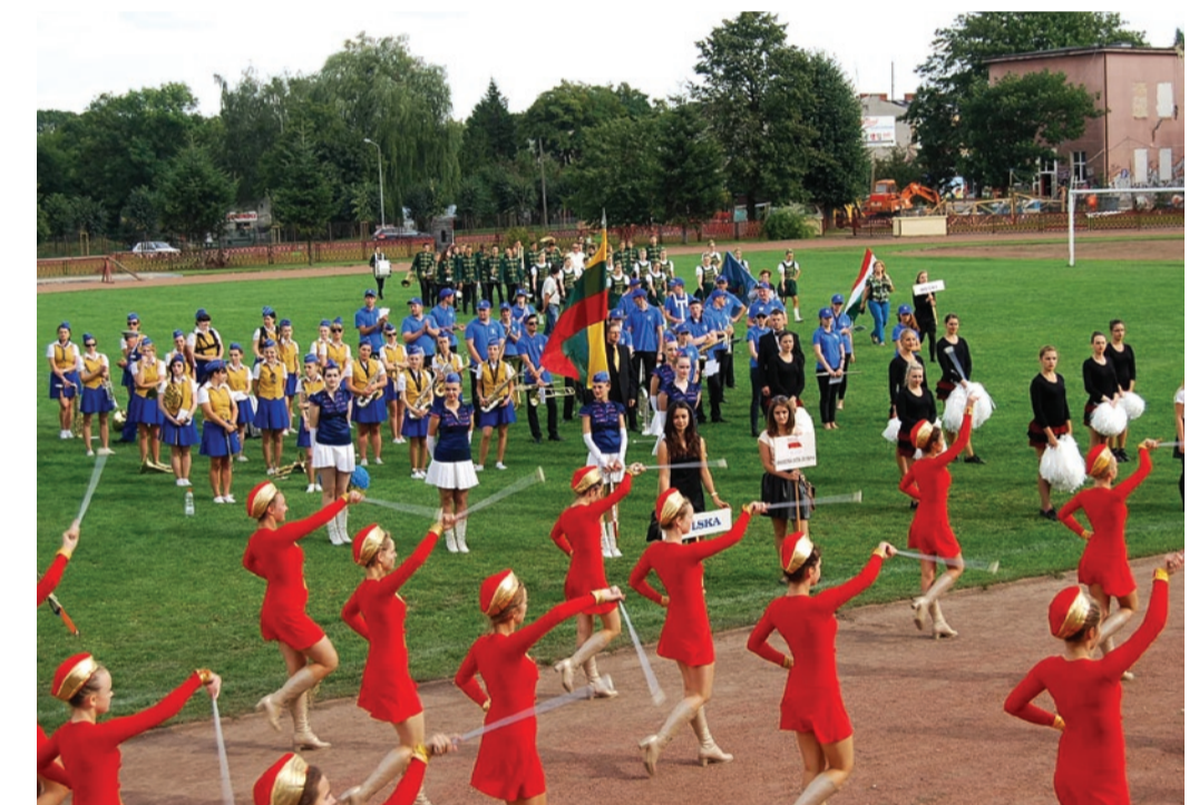
Parada Orkiestr Dętych

Jak co roku, również w te wakacje, zagościmy z działaniami animacyjnymi na płońskich osiedlach. Będziemy bawić się i grać w gry sportowe, puszczać olbrzymie bańki mydlane, śpiewać i tworzyć minispektakle. Zapraszamy do wspólnej zabawy we wtorki i czwartki w godz. 11 – 13