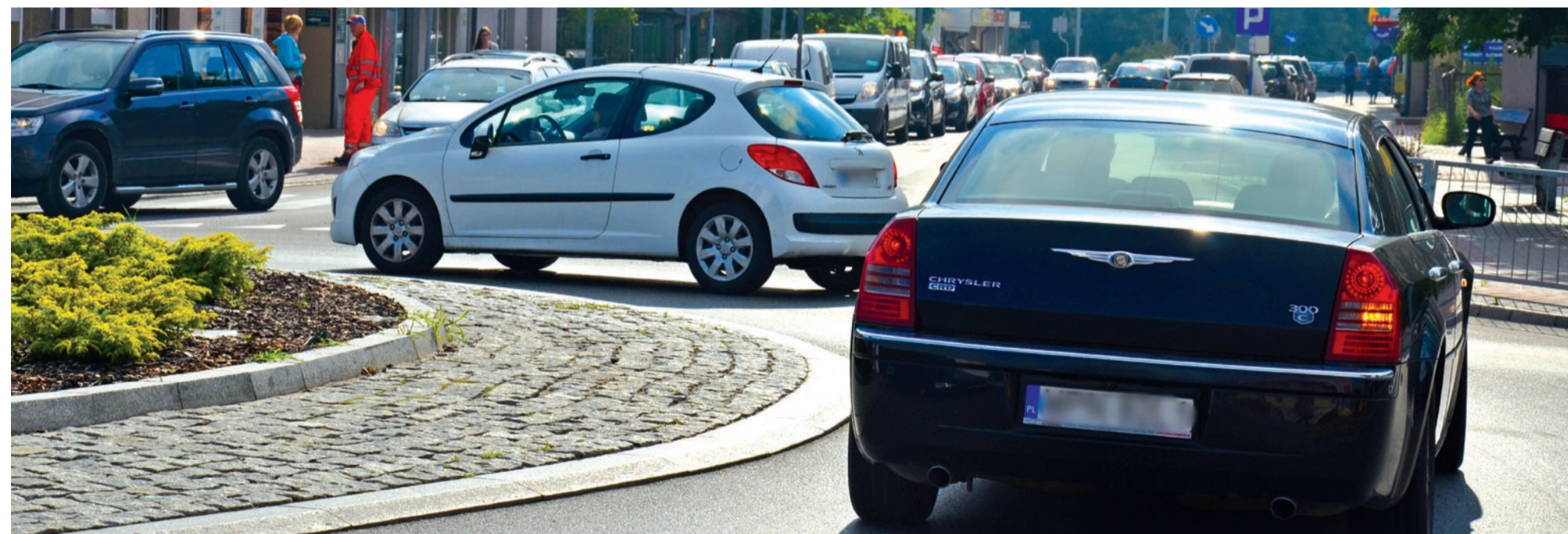
Rondo przy ulicy Płockiej

- Od prawie czterech lat chodzę do pracy pieszo. Jestem punktualny, więc zarezerwowanie odpowiedniego czasu na dotarcie do urzędu nie stanowi dla mnie większego problemu. Z przymrużeniem oka, ale szczerze, mogę powiedzieć, że nie straszna mi słońca i mróz. Warto sobie uświadomić, że taki poranny spacer to dla większości z nas bardzo często jedyna aktywność fizyczna w ciągu dnia.