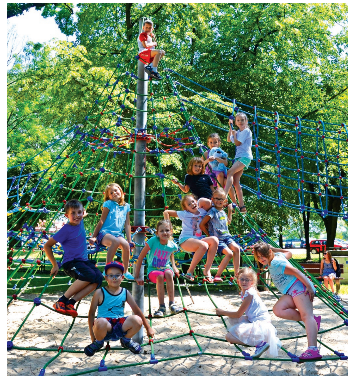
Plac zabaw w Ogródku Jordanowskim

Szczegóły na stronach MCK i na plakatach.