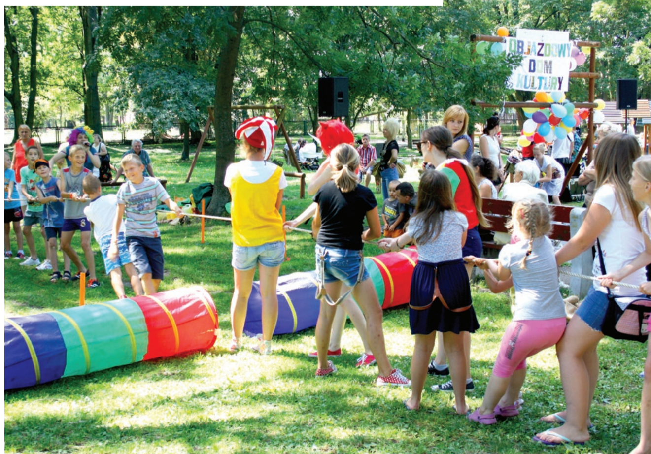
Objazdowy Dom Kultury