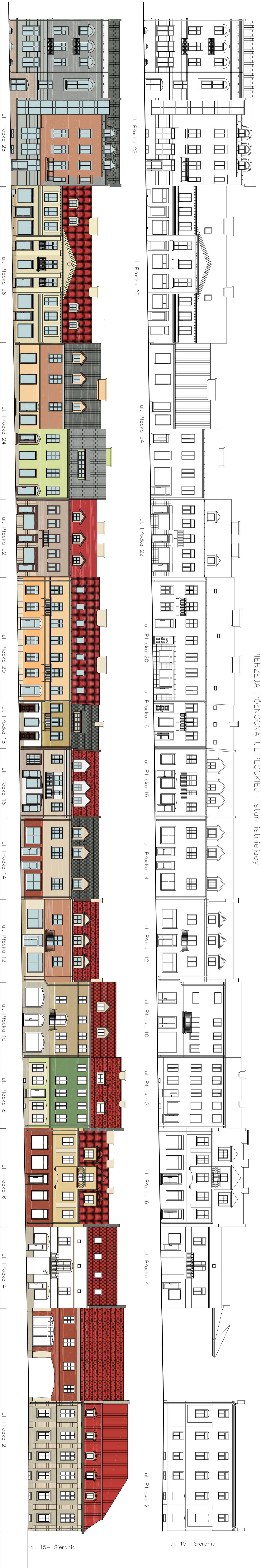
PIERZĘCIA PÓŁNOCNA UL. PIASEKI – stan istniejący