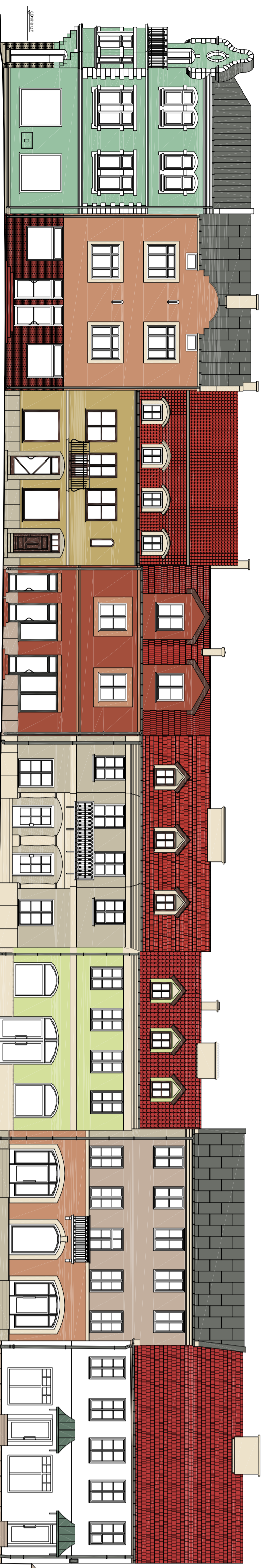
PIERZĘCIA PÓŁDNIOWA UL. PIASEKI –projektywano