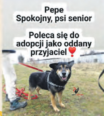
Pepe Spokojny, psi senior

Pogos 2-letni psi chłopak poleca się do adopcji 😊