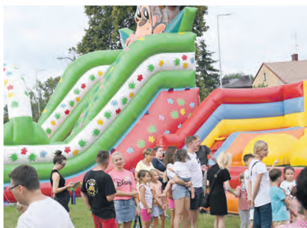
Dzień Dobry Wakacje

PROPOZYCJA ZAJĘĆ I WYDARZEŃ ARTYSTYCZNYCH NA WAKACJE 2023 W MIEJSKIM CENTRUM KULTURY W PŁOŃSKU